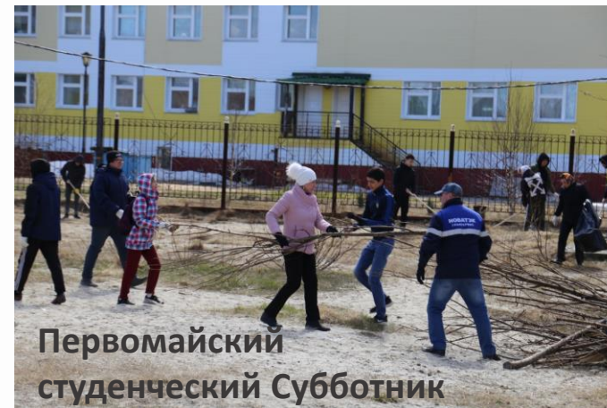
Первомайский студенческий Субботник