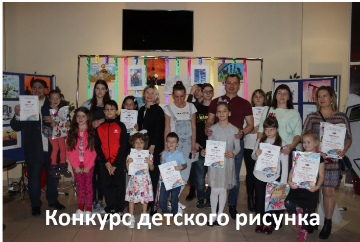
Конкурс детского рисунка