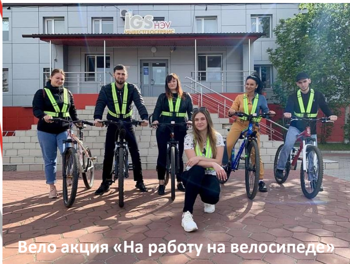
Вело акция «На работу на велосипеде»